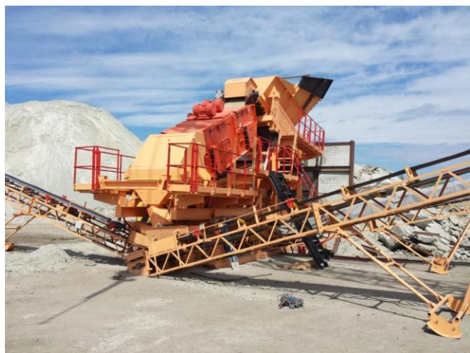
ULS3514.22N. Переработка отвалов известняка по классам 4 мм и 1.4 мм, Эстония.