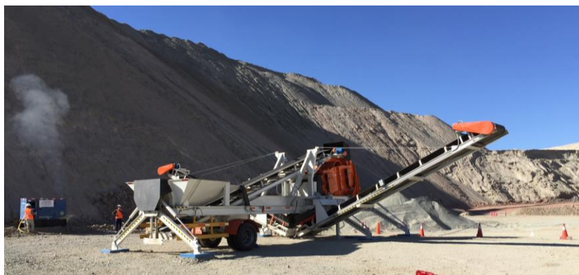
ULS2814.21. Переработка отвалов обогащения медной руды по классам < 1 мм, Чили.