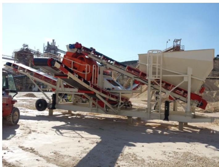
ULS2814.21. Переработка отвалов известняка по классам 3 мм и 1.4 мм, Израиль.